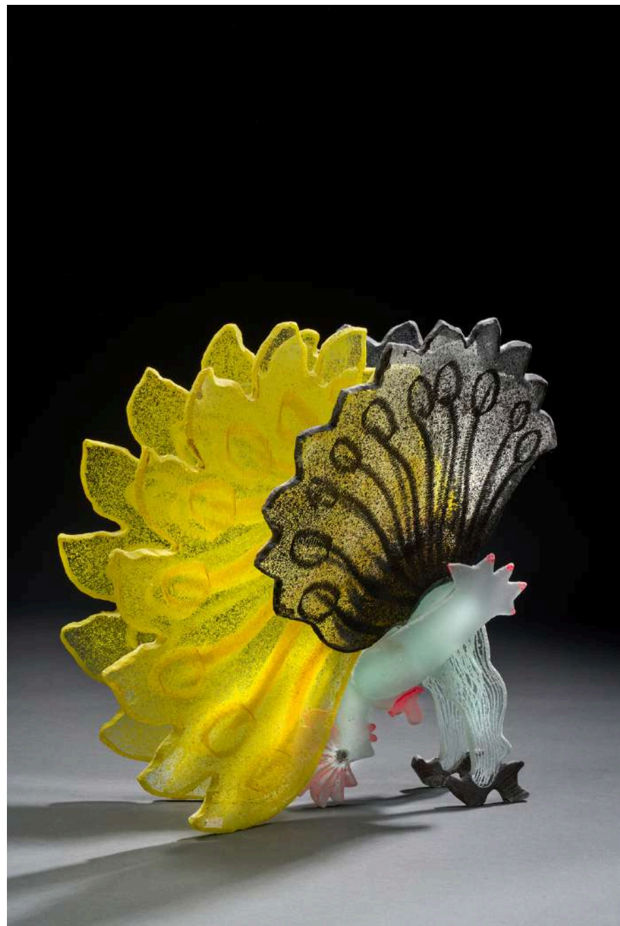
Cancan jaune et grise , 2019, verre découpé, sablé, gravé, coloré, 46x48x34cm 15 000€