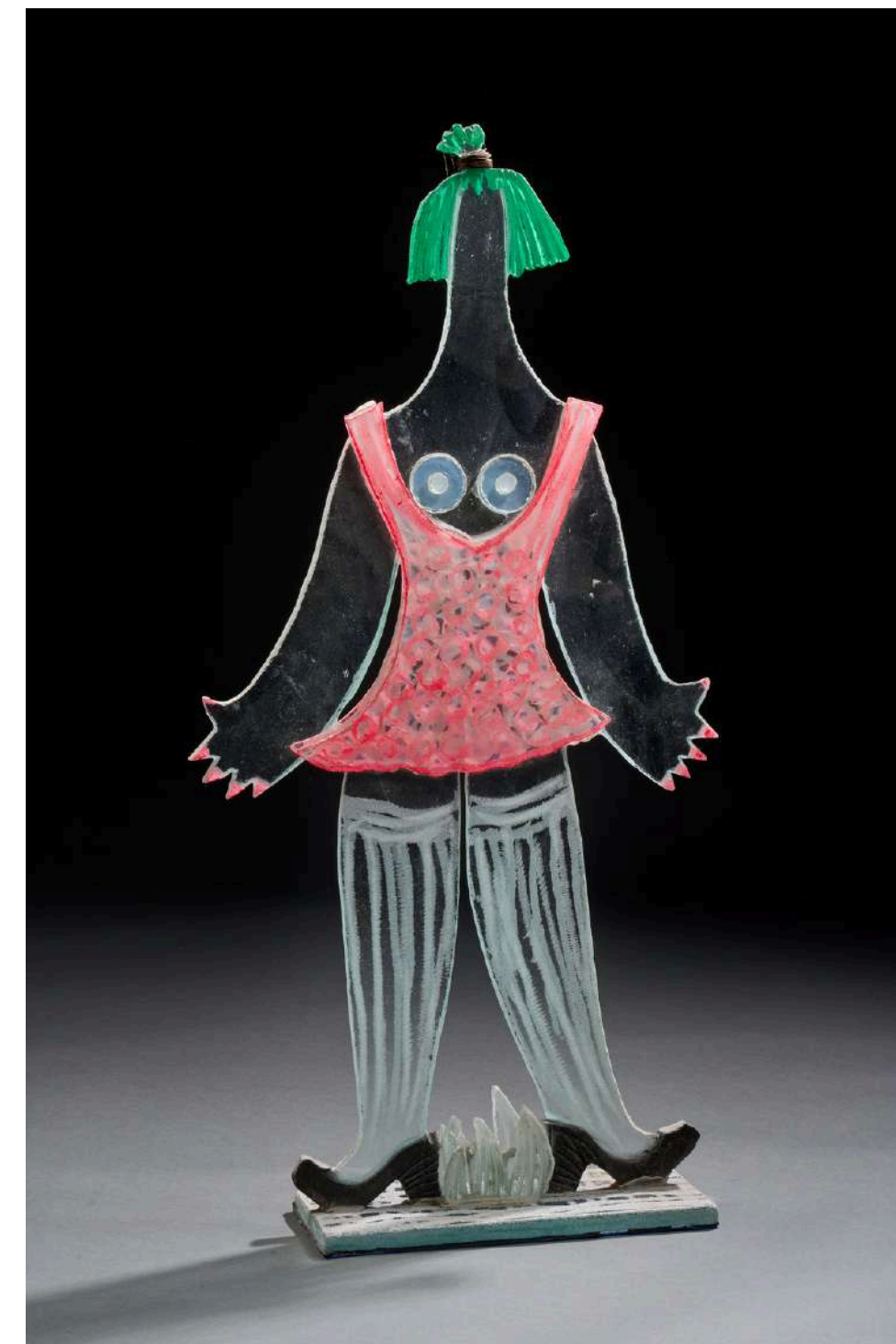
Nana plate gilet rose , 2020, verre découpé, sablé, gravé, coloré, 81x40x11cm 7 000€