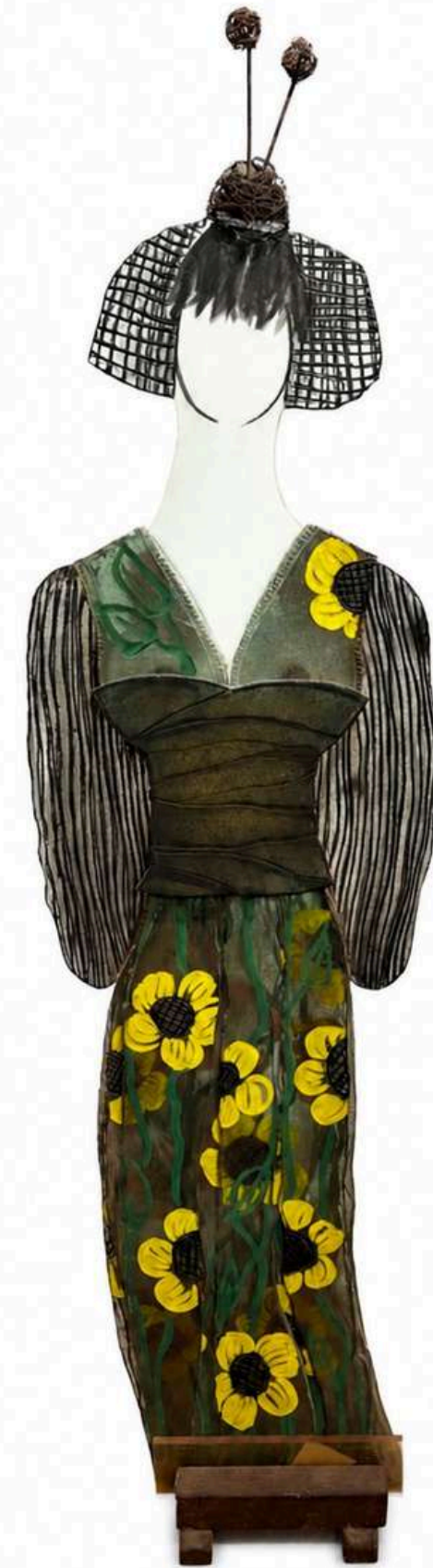
Geisha , 1998, verre découpé, sablé, gravé, coloré, et fil de fer, 212x57x5cm 60 000€