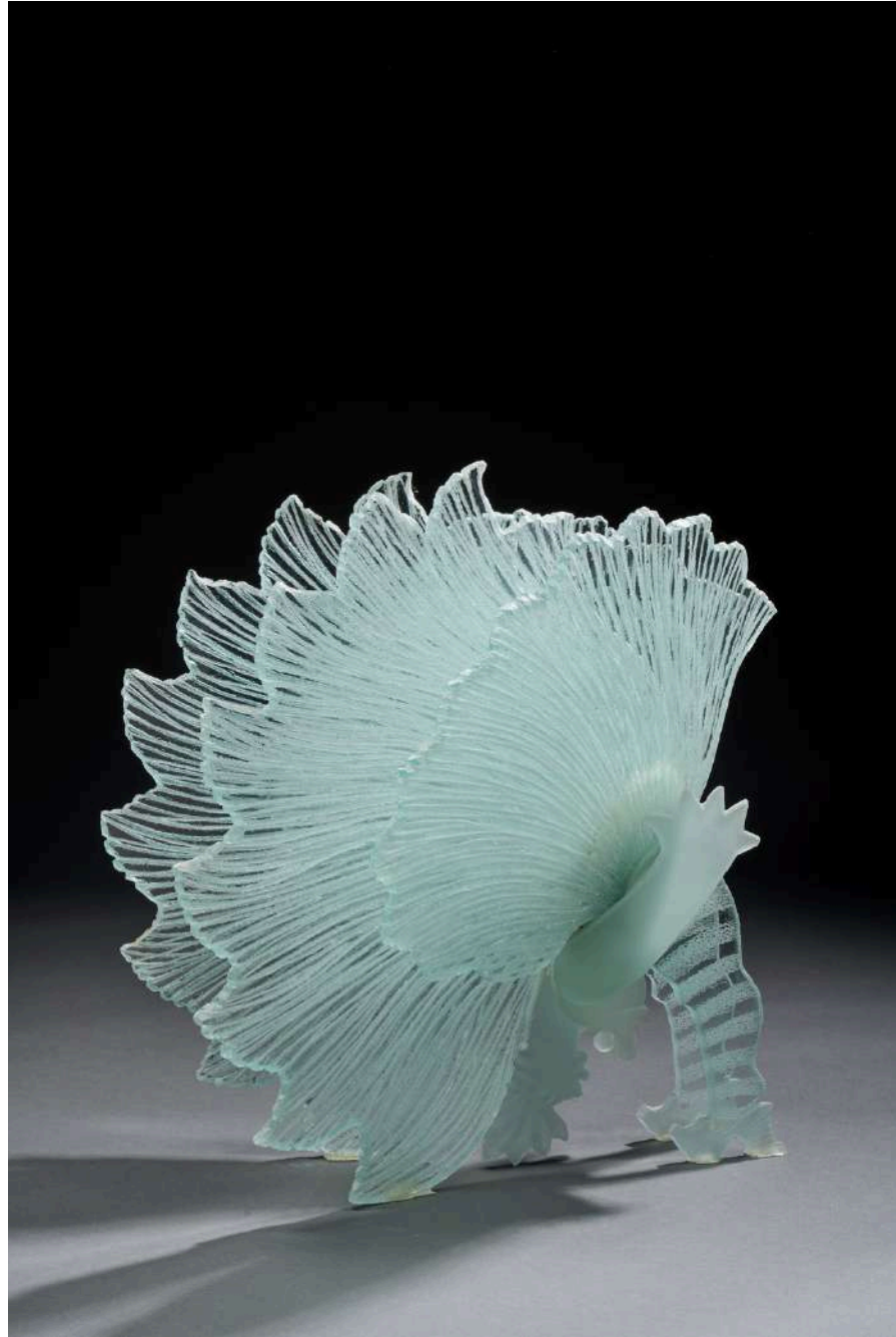
Cancan transparente, 2019, verre découpé, sablé, gravé, 49x49x32cm